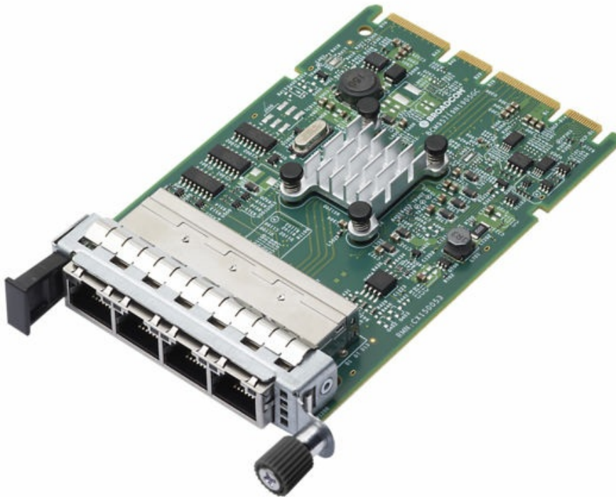
Figure 2. ThinkSystem Broadcom 5719 1GbE RJ45 4-port OCP Ethernet Adapter

The following figure shows the Broadcom 5719 1GbE RJ45 4-port OCP Ethernet Adapter.